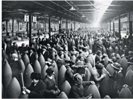
Ouvrières dans une usine en Angleterre pendant la guerre

Quelles sont les conditions de vie des soldats dans ces fossés ?